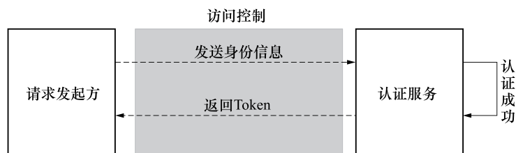
图 2 平台认证方式

用户身份认证成功后授予 Token，每次向服务端请求资源的时候需要带着服务端签发的 Token，服务端验证 Token 成功后，才返回请求的数据。Token 的有效期由服务方确定，最长不应超过 7 天，Token 丢失或失效后需要再次发起认证服务。分布式认证的认证接口规范见附录 A。